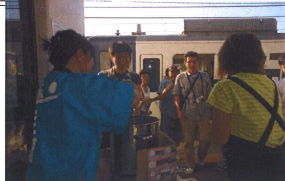
■青海川駅ホームでは地元観光協会の皆さんが「もずく汁サービス」や「特産品販売」で柏崎PR。

車内では地酒試飲 ジャズ演奏♪ 青海川駅では「もずく汁」で（毎週金曜日のみ）おもてなし！